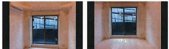
▲立った状態で水平を意識せず撮った写真(左)と、しゃがみ込み、壁に背中を合わせて水平に撮影した写真(右)

部屋を撮る際、常に意識しておきたい基本が「水平に撮る」こと。部屋全体の写真を撮るときは、しゃがみ込み、背中を壁につけてカメラを構えると、無理なく水平に撮影できます。また、しゃがむと目線が低くなるため、写真の中の床の割合が増え、部屋も広く感じられます。