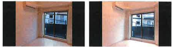
▲調整なしで撮影した写真(左)とピントと明るさを調整した写真(右)